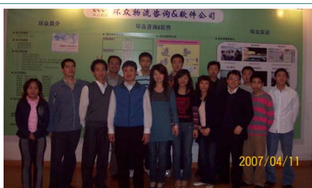
第四批次学员结业留念