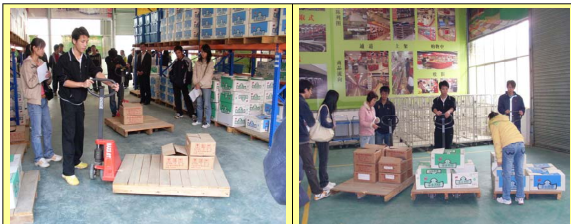
南宁实训物流作业实操