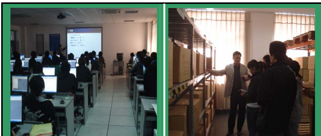
上海工程技术大学物流实训